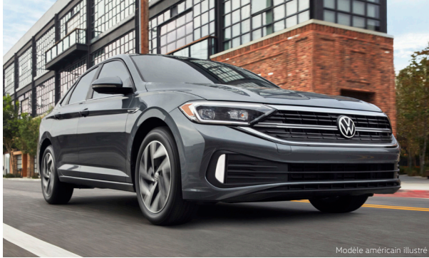
Modèle américain illustré