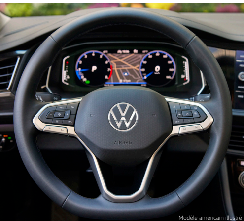
Modèle américain illustré

La Jetta est équipée d'une variété de caractéristiques qui vous permettent de garder votre confiance au volant. Prenez la route sans souci grâce aux fonctionnalités d'aide à la conduite, telles que l'Assistant avant de série avec Freinage d'urgence autonome et Surveillance des piétons 1 , ainsi que le Moniteur d'angles morts avec Avertisseur de véhicules à l'arrière 1 en option.