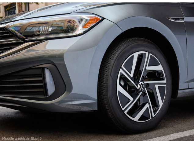
Modèle américain illustré

Cuir noir Titan HL Sièges en cuir brun volcan avec garnitures de couleur noir Titan HL