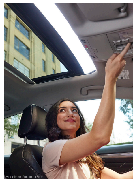
Modèle américain illustré

Elle se démarque ainsi avec ses caractéristiques de série comme ses phares à DEL, ses sièges avant chauffants et confortables, ainsi que ses roues en alliage de 16 po. Vous pouvez aussi opter pour l'ensemble sport offert en option, qui comprend des caractéristiques haut de gamme comme un toit ouvrant électrique Rail 2 Rail, un éclairage ambiant intérieur de 10 couleurs, un pare-choc sport et le cockpit numérique Pro Volkswagen.