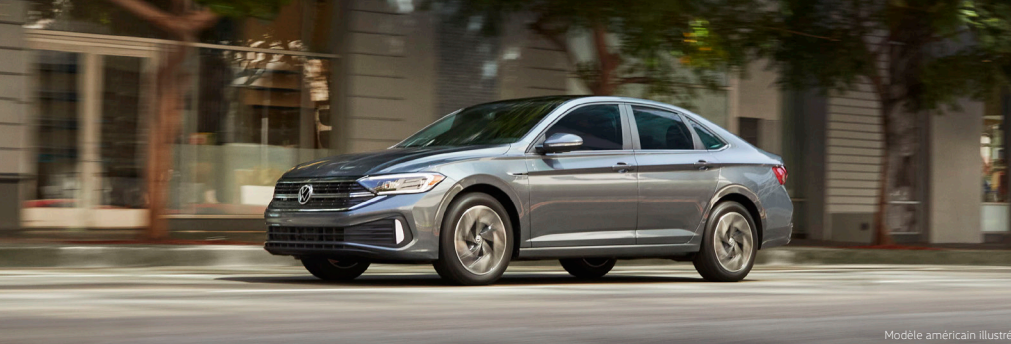
Modèle américain illustré